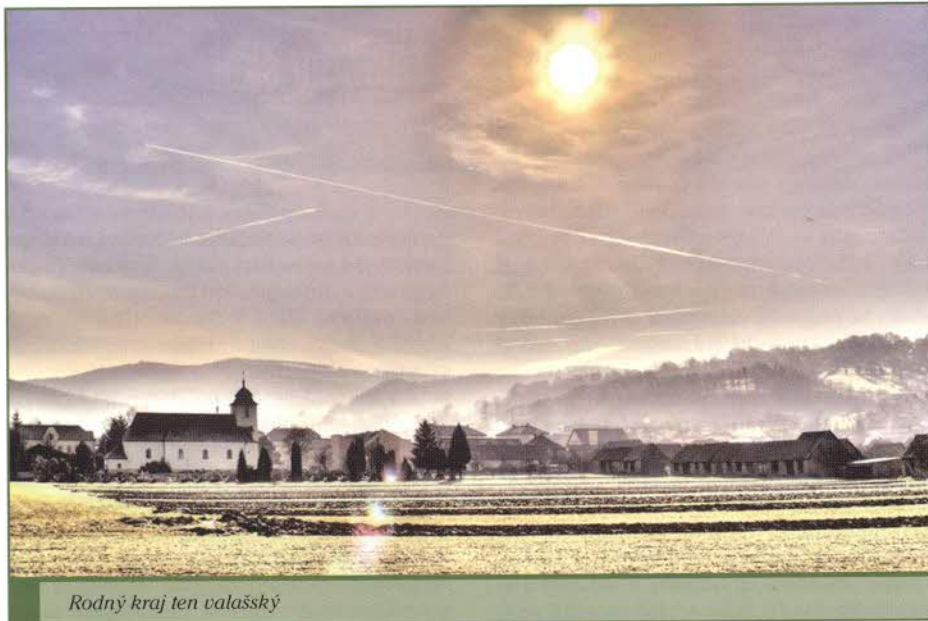
Rodný kraj ten valašský

JARNÍ VYDÁNÍ Č. 68 BŘEZEN 2017 ROČNÍK XVIII.