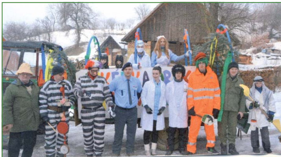
Tradiční fašanky v Popově

Po novém roce jsme začali připravovat tradiční fašanky. Ty proběhly 9. února. Naši obcí projížděl alegorický vůz s hudbou a tématem letošních fašanků byl slogan „LIKÉRKA DRÁK VYTŘE VÁM ZRAK“.