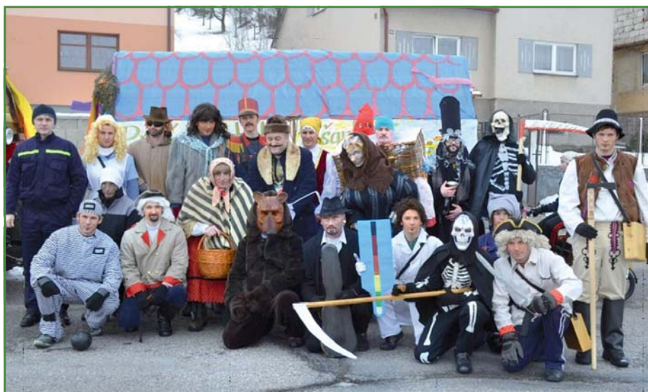
Fašanky ve Štítné

Současně proběhla volba „popovského prezidenta“. Vítěz zůstal utajen. Členové výboru SDH děkují všem občanům, kteří poskytli pohoštění i finanční částku obcházejícím fašankům.