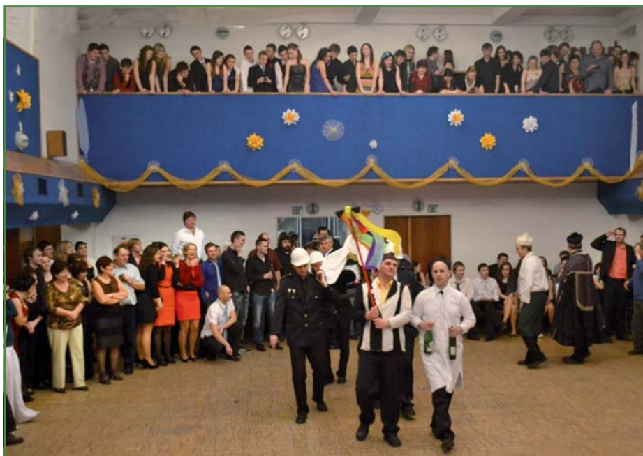
Fašankovské veselí ukončilo pochování basy