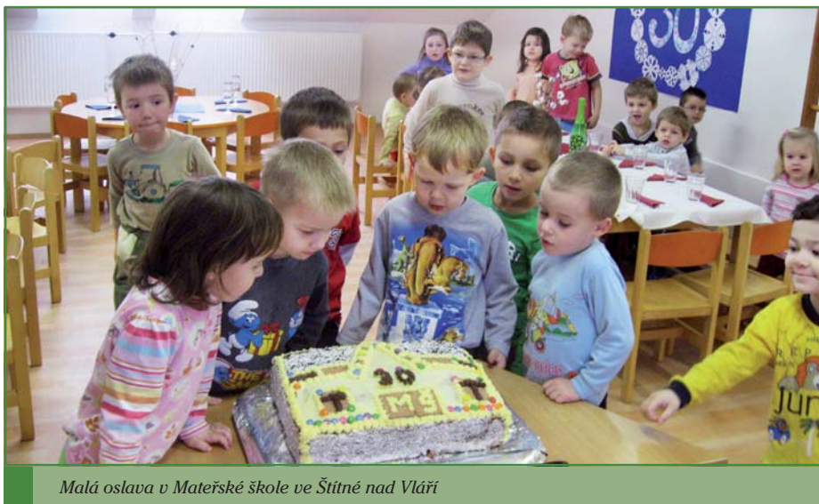
Malá oslava v Mateřské škole ve Štítné nad Vláří

Chcete mít kvalitní spánek bez roztočů? Kupte si protialergenní polštář a peřinu od firmy INTERMEDIC s.r.o. Stačí objednat na www.intermedic.cz Nyní za nejnižší cenu na trhu – jen za 642,- Kč.